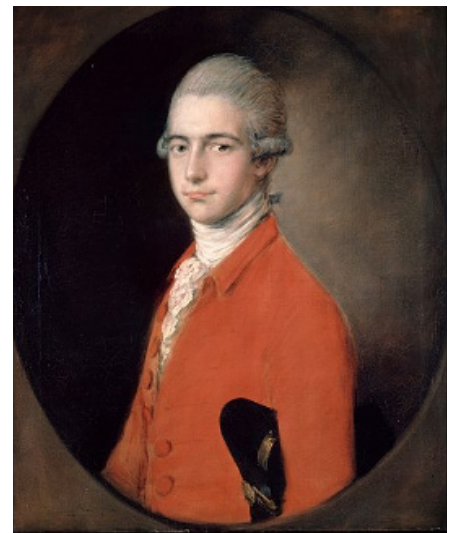
Thomas Linley jr. 1756 – 1778