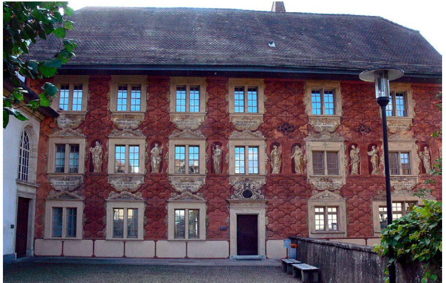
Das alte Lateinschulhaus mit der «Musica», zweite Figur links